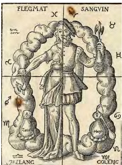
Bilder aus Leonhard Thurneseyser, Quinta essentia, Basel 1574

Pflanzenwasser – die „ GEPRENTEN WASSER “ des Hieronymus Brunschwig – hatten vor 500 Jahren beinahe den Stellenwert in Medizin und Behandlung, den Tinkturen heute haben. Grundsätzlich wurden die „geprenten wasser“ damals eher innerlich verwendet und Tees eher äußerlich für Wundwaschungen und Umschläge.